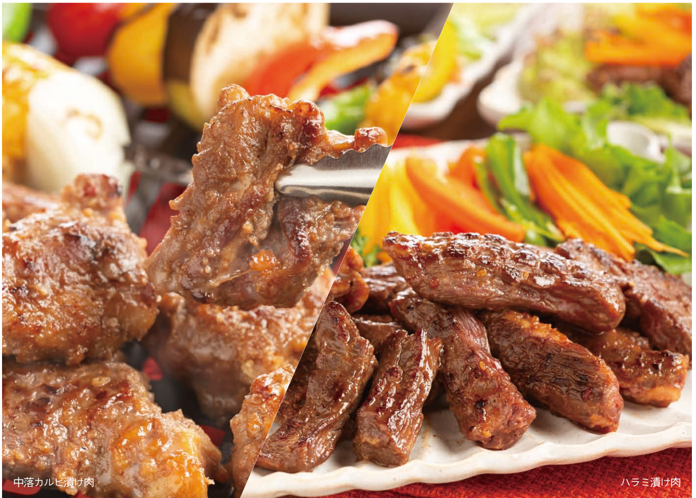
中落カルビ漬け肉